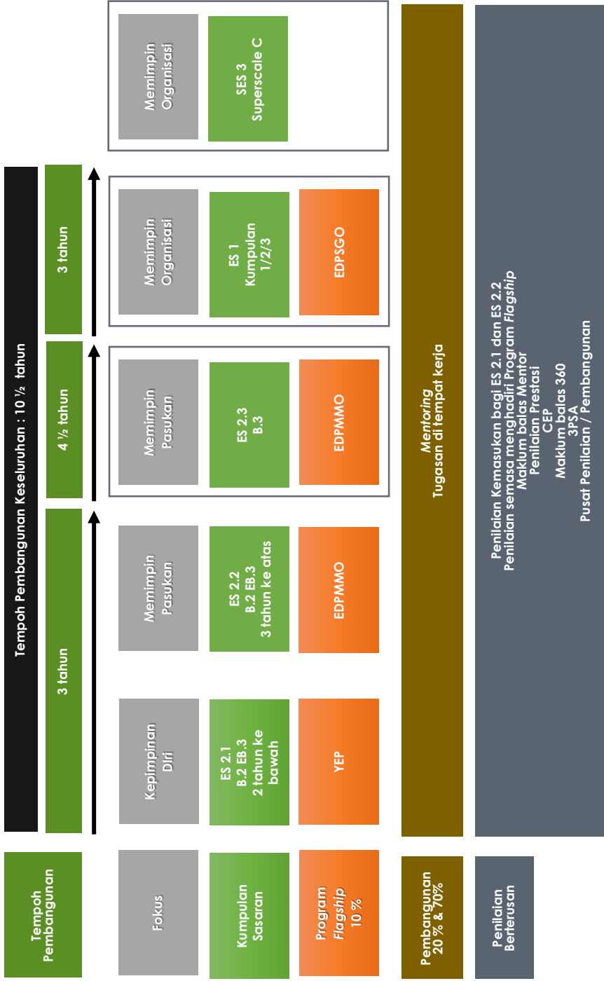
Rajah 3 : Pengurusan Bakat & Pembangunan CSLP