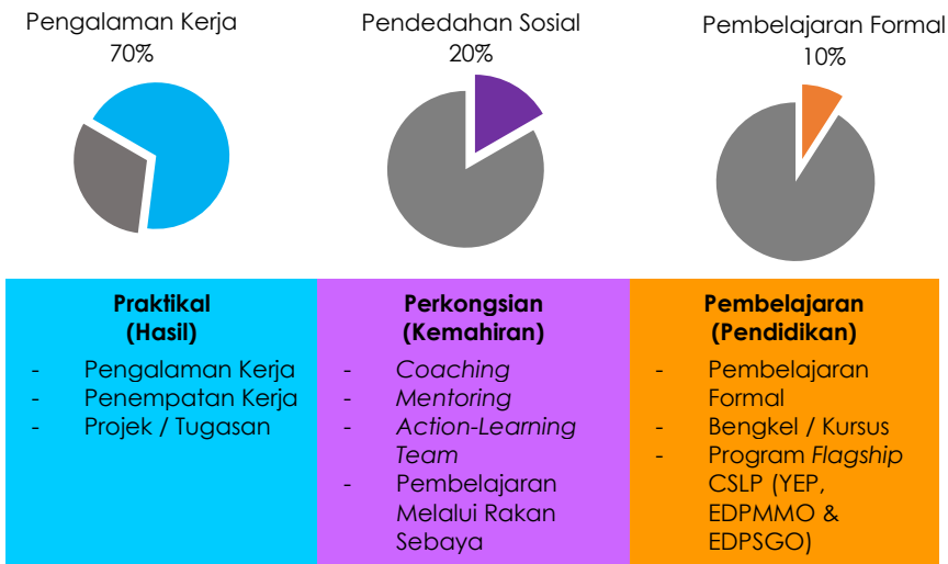
Rajah 4 : Model Pembelajaran